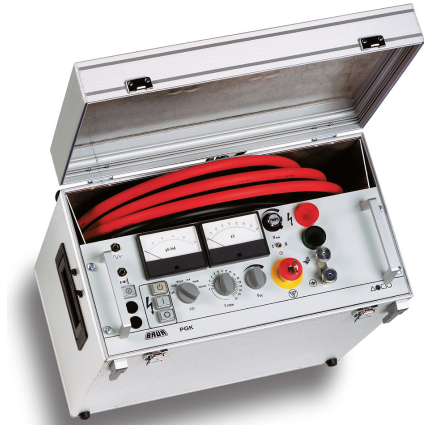
Ilustración a modo de ejemplo